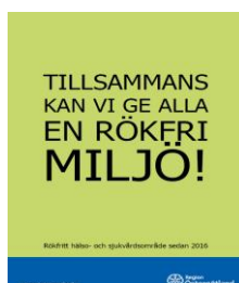
Bild på nya gatupratare.