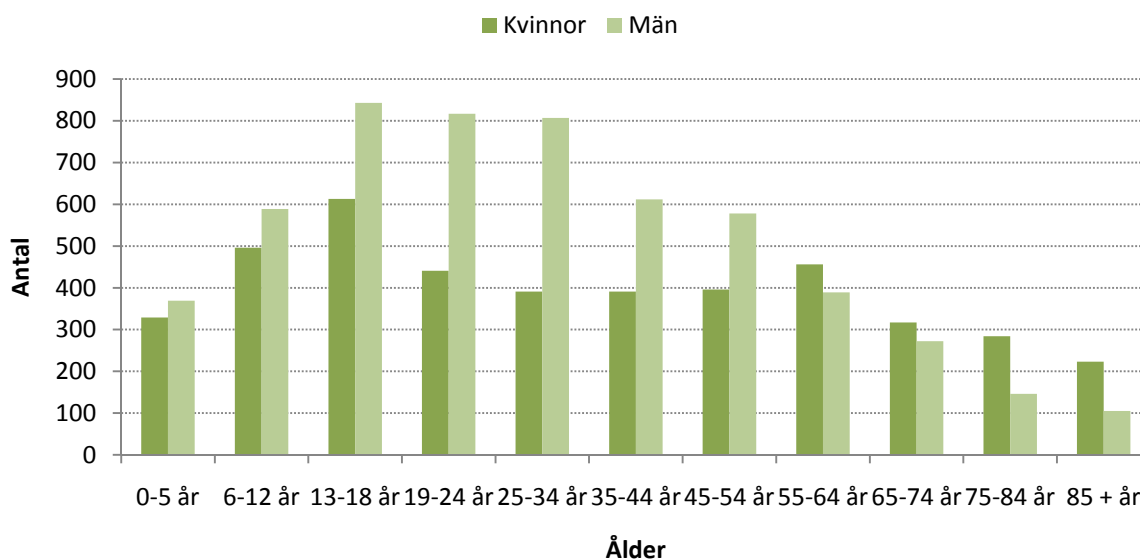
Figur 1. Antalet skadefall fördelade efter kön och ålder.

År 2010 registrerades 9 884 skadeblanketter på sjukhusen i länet. På nästan alla (9 864) skadeblanketter finns både kön och ålder registrerade. Av de skadade är 56 procent män och 44 procent kvinnor. De mest skadedrabbade åldersgrupperna är 13—18 år följt av 19—24 år.